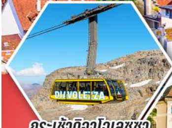
กระเช้าดิวาโอเลซซ่า