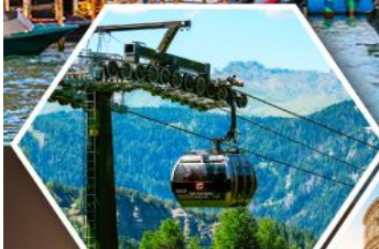
กระเช้าโตโลโมท์