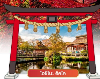
โอินะ ฮัคโค

เดินทางโดยสายการบิน : ไทยแอร์เอเชียเอ็กซ์