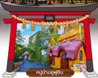
หมู่บ้านยูฟุอิน