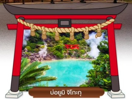
บ่อน้ำพุร้อน จิโกกุ