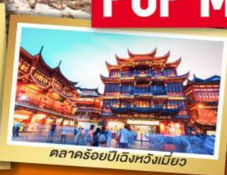
ตลาดร้อยปีเมืองหวงเหมียว