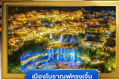
เมืองโบราณฟูหลงเจิ้น