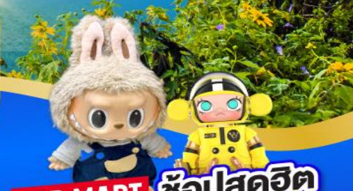
POP MART ซ้อปสุดฮิต