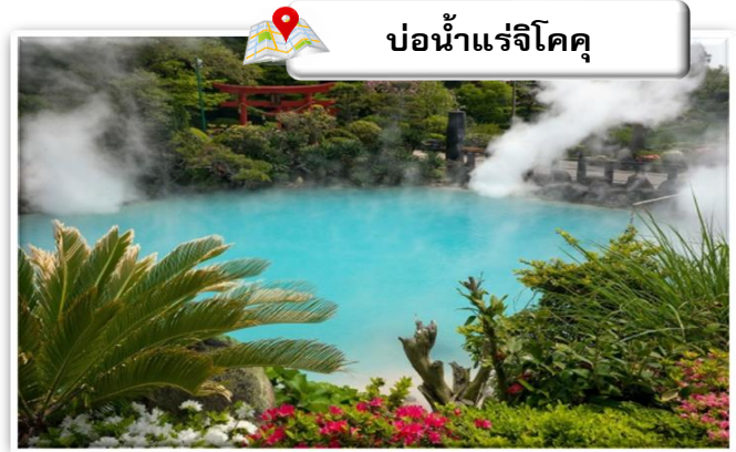
บ่อน้ำแร่จิโคคุ

เดินทางสู่ บ่อน้ำพุร้อน (Jigoku Meguri) หรือ บ่อน้ำพุร้อนขุมนรกทั้งแปด เป็นบ่อน้ำพุร้อนธรรมชาติที่เกิดขึ้นภายหลังจากการระเบิดของภูเขาไฟ ประกอบไปด้วยแร่ธาตุที่เข้มข้น เช่น กำมะถัน แร่เหล็ก โซเดียม คาร์บอเนต เรเดียม เป็นต้น และร้อนเกินกว่าจะลงไปอาบได้ แล้วบ่อทั้ง 8 บ่อ ก็ตั้งชื่อให้น่ากลัวตามลักษณะภายนอกที่เห็นกัน