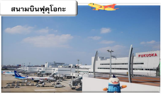
สนามบินฟุคุโอกะ

เวลา 00.55 น. ออกเดินทางสู่ สนามบินฟุคุโอกะ ประเทศ ญี่ปุ่น โดย สายการบินไทย เที่ยวบินที่ T5648