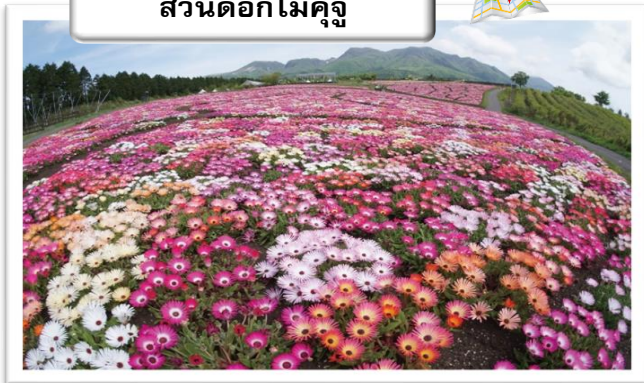
สวนดอกไม้คuju

จากนั้นเดินทางสู่ สวนดอกไม้คuju เป็นสวนดอกไม้อยู่ใน Kujū kogen ของเขตทาเคตะ จังหวัดโออิตะ ช่วงระยะเวลาที่เปิดให้ชมคือเดือนมีนาคม ถึงเดือนพฤศจิกายน สนุกไปกับดอกไม้ 500 ชนิด กว่า 5,000,000 ดอก ในพื้นที่ป่าไม้และพื้นที่ดอกไม้