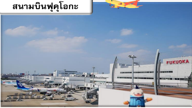
สนามบินฟุคุโอกะ

เวลา 00.55 น. ออกเดินทางสู่ สนามบินฟุคุโอกะ ประเทศ ญี่ปุ่น โดย สายการบินไทย เที่ยวบินที่ T5648