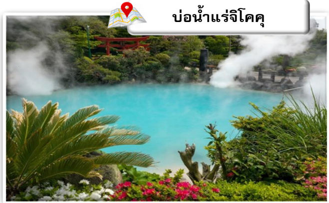
บ่อน้ำแร่จิโคคุ

เดินทางสู่ บ่อน้ำพุร้อน (Jigoku Meguri) หรือ บ่อน้ำพุร้อนขุมนรกทั้งแปด เป็นบ่อน้ำพุร้อนธรรมชาติที่เกิดขึ้นภายหลังจากการระเบิดของภูเขาไฟ ประกอบไปด้วยแร่ธาตุที่เข้มข้น เช่น กำมะถัน แร่เหล็ก โซเดียม คาร์บอนเนเรเดียม เป็นต้น และร้อนเกินกว่าจะลงไปอาบได้ แล้วบ่อทั้ง 8 บ่อ ก็ตั้งชื่อให้น่ากลัวตามลักษณะภายนอกที่เห็นกัน