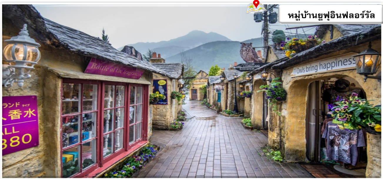
📍 หมู่บ้านยูฟูอินฟลอรัล

เดินทางสู่ ยูฟูอิน (Yufuin) เป็นเมืองชนบทเล็กๆ ที่มีทิวทัศน์ที่สวยงามมากโดยเฉพาะช่วงฤดูใบไม้ผลิที่จะมีทั้งดอกซากุระบนต้นไม้ และดอกเรปซีป ที่พื้นด้านล่าง พร้อมกับแม่น้ำ และภูเขา อีสระเดินชม หมู่บ้านยูฟูอินฟลอรัล เป็นหมู่บ้านจำลองสไตล์ยุโรป มีกลิ่นอายยุโรปโบราณ ไฮไลท์ ประจำเมืองยูฟูอิน บ้านอิฐที่แสนคลาสสิคเรียงรายอยู่บนถนนสายเล็กๆ ประดับประดาไปด้วยดอกไม้บานนานาชนิด