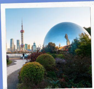
North bund green land