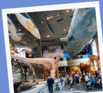
Shanghai Natural history Museum