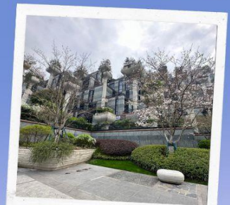
ห้าง Tian AN 1,000