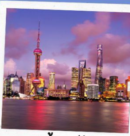
ชมวิวยังหอไข่มุก