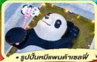
• รูปปั้นหมีแพนด้าเซลฟี