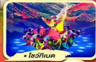
• โชว์ทึเบต