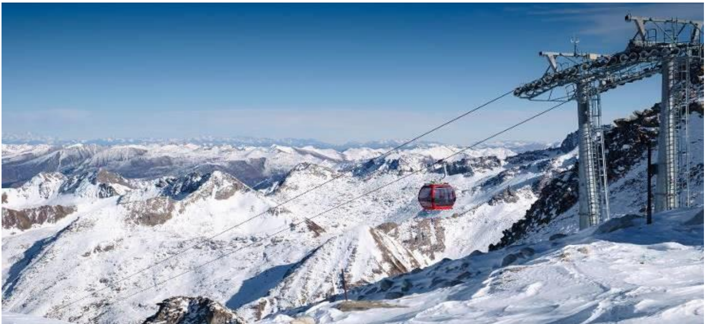
GO1TFU-CA001 เฉิงตู จิวจ้ายโกว หวงหลง ภูผาหิมะกลาเซียร์ต้ากู่ปิงชว่น ศูนย์หมีแพนด้า 7วัน6คืน โดยสายการบิน Air China (CA)

เช้า รับประทานอาหารเช้า ณ ห้องอาหารภายในโรงแรม (มื้อที่ 10)