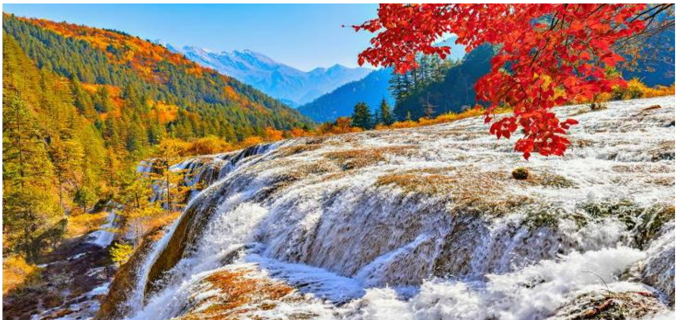
GO1TFU-CA001 เฉิงตู จี๋จ้ายโกว หวงหลง ภูผาหิมะกลาเซียร์ต้ากุ่ปิงชวณ ศูนย์หมีแพนด้า 7วัน6คืน โดยสายการบิน Air China (CA)

ทะเลสาบ5สี เป็นทะเลสาบที่มีสีของน้ำแปลกตา โดยเฉพาะเมื่อยามแสงอาทิตย์ตกกระทบพื้น สีของน้ำในทะเลสาบจะเปล่งประกายเปลี่ยนสีรูปร่างดูงดงามมาก เป็นอุทยานที่เหมาะแก่การไปถ่ายพรีเวดดิ้งธีมเทพนิยายมากๆ