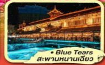
• Blue Tears สะพานหนานเฉียว

★ ไม่ลงร้านช้อปปิ้ง ★ พัก 4 ดาว ★ ชมโชว์ทึเบต