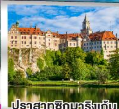
ปราสาทชิลลมาริงกัน