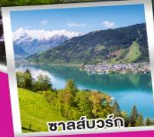
ชาลส์บวร์ก

ยอดเขาริเกิ ราชินีแห่งขุนเขาสวิตเซอร์แลนด์