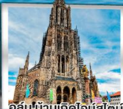
อูล์มบ้านเกิดไอน์สไตน์