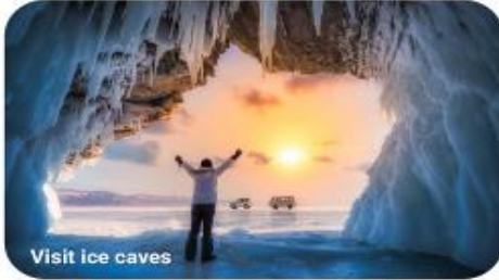
Visit ice caves