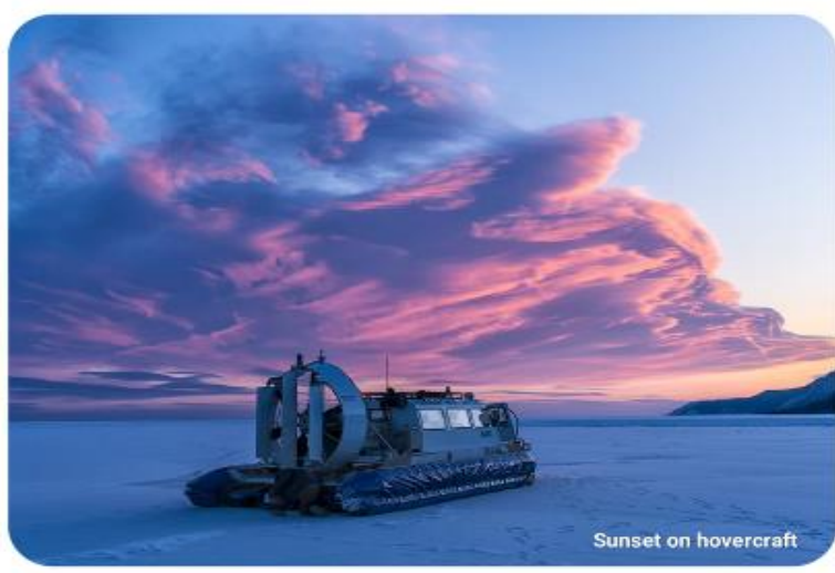
Sunset on hovercraft