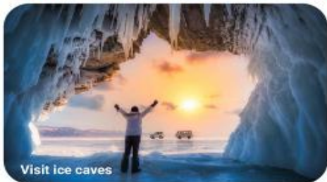
Visit ice caves