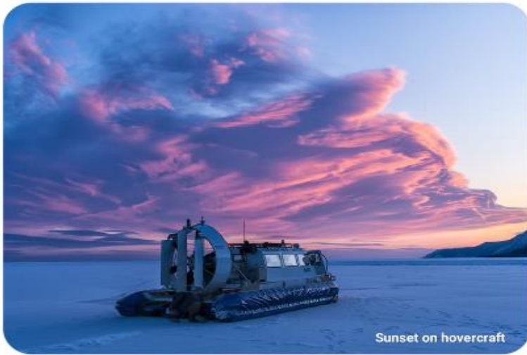
Sunset on hovercraft