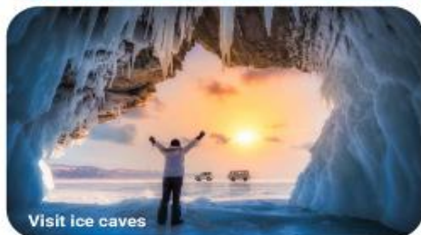
Visit ice caves