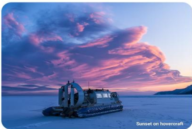
Sunset on hovercraft