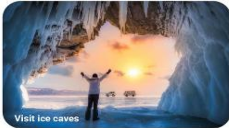
Visit ice caves