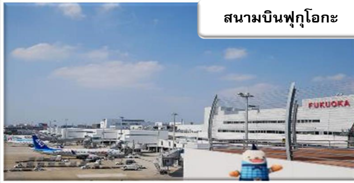
สนามบินฟูกูโอกะ

เวลา 01.45 น. ออกเดินทางสู่ สนามบินฟูกูโอกะ ประเทศญี่ปุ่น โดยสายการบินไทยแอร์เอเชีย เที่ยวบินที่ FD 236