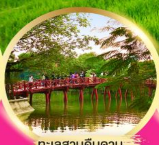
ทะเลสาบคินดาบ