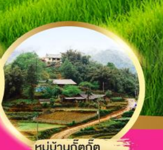
หมู่บ้านกัตกัต