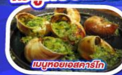
เมนูหอยออสเตรเลีย

ทานอาหาร ณ ภัตตาคารบนหอไอเฟล พร้อมชมวิวแสนโรแมนติก เมนูหอยแมลงภู่นิวซีแลนด์