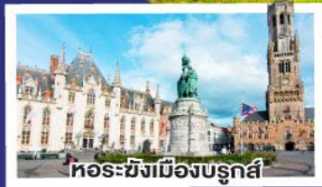
หอระฆังเมืองบรูจส์