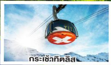
กระเช้าทิลิส