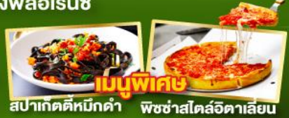
เมนูพิเศษ สปาเก็ตตีหมึกดำ พืชซ่าสโด้อิตาลี