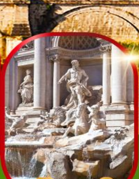
น้ำพุกรวี