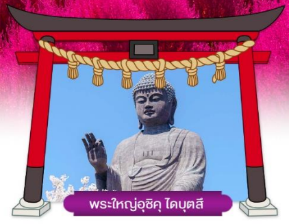
พระใหญ่อุซึคุ ไคบุตสึ