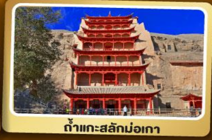
ถ้ำแกะสลักม่อเกา