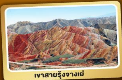
เขาสายรุ้งจางเย่