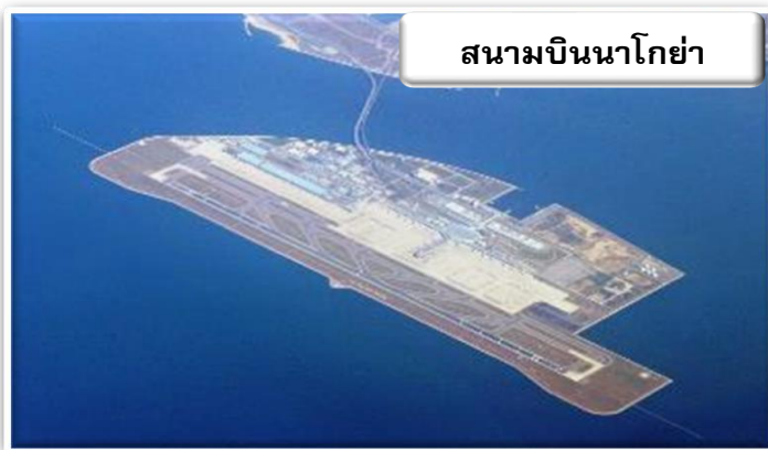
สนามบินนาโกย่า

บริการอาหารร้อนบนเครื่องพร้อมกับเมนูผลไม้สดเพื่อเติม เต็มความพิเศษไปพร้อมๆกับความสดชื่น