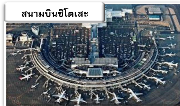
สนามบินซีโตเสะ

เวลา 01.20 น. ออกเดินทางสู่ สนามบินซีโตเสะ ประเทศ ญี่ปุ่น โดย สายการบินไทยแอร์เอเชีย เอ็กซ์ เที่ยวบินที่ XJ 620