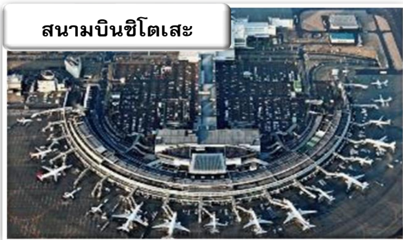
สนามบินซีโตเสะ

เวลา 01.20 น. ออกเดินทางสู่ สนามบินซีโตเสะ ประเทศญี่ปุ่น โดย สายการบินไทยแอร์เอเชีย เอ็กซ์ เที่ยวบินที่ XJ 620