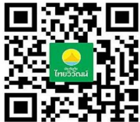
รายละเอียดกรมธรรม์ไทยวิวัฒน์