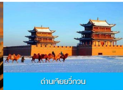
ด่านเจียวกวน

1 Sep เมืองจางเยี่ย – เที่ยวชมอุทยานภูเขาสายรุ้ง-เดินทางสู่เมืองเจียวกวน -เที่ยวชมด่านเจียวกวน เช้า รับประทานอาหารเช้า ณ ห้องอาหารของโรงแรม