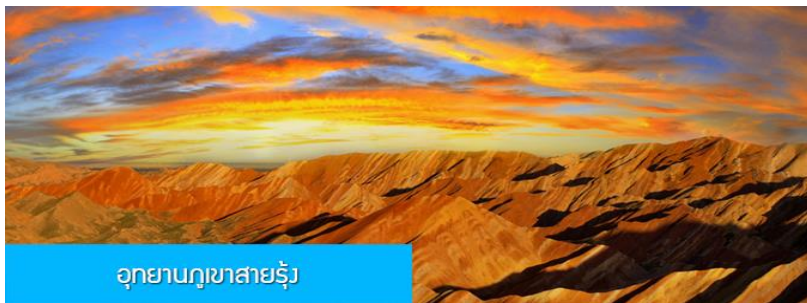
อุทยานภูเขาสายรุ้ง

พักที่ โรงแรม QIANXI SILU HOTEL ระดับ 4 ดาวห้องถิ่นหรือเทียบเท่าในเมืองจางเยี่ย