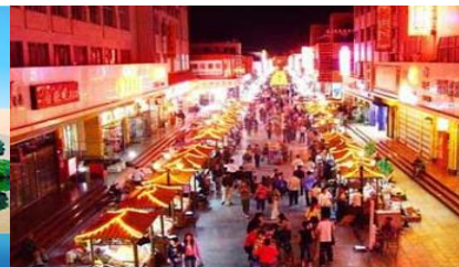
ตลาดกลางคืน ซาโจว