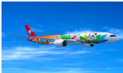
บินภายในสู่หลันโจว