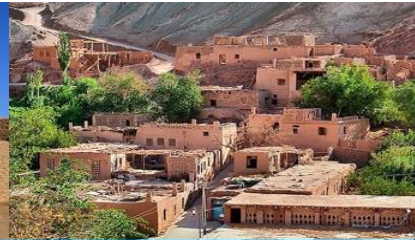
หมู่บ้านอุยกูร์

4 Sep ชมระบบชลประทานอู่หลู่ฟาน – ถ้ำพระพันองค์- เมืองโบราณเกาซางกู๋เจิง-หมู่บ้านอุยกูร์ –เดินทางสู่เมืองอูรูมูฉี