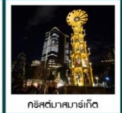
คริสตมาสไลท์