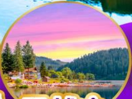
ทิกิเซ่ ปาดำ