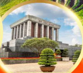
สุสานโฮจิมินห์