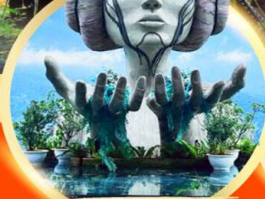
โฮอาน่า ซาปา คาเฟ่