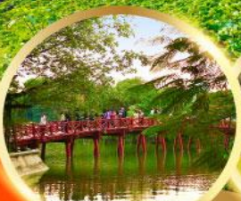
ทะเลสาบคินดาบ