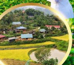
หมู่บ้านกัตกัต