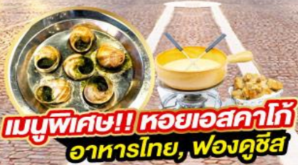
เมนูพิเศษ!! หอยเอสคาโก้ อาหารไทย, พองคูซัส