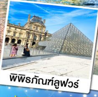
พีพีร์กัทหลูฟวร์