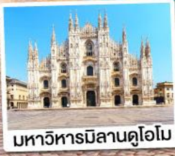
มหาวิหารมิลานดูโอโม