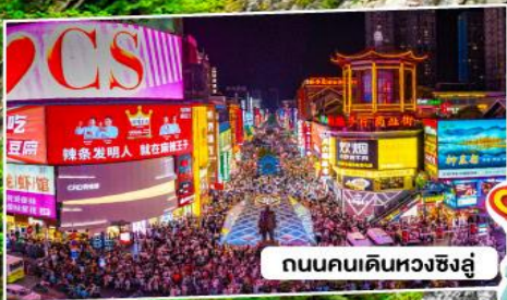
ถนนคนเดินหวงชิ่งอู่