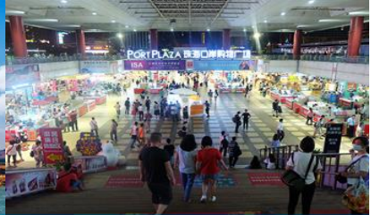
ตลาดใต้ดินกงเป่