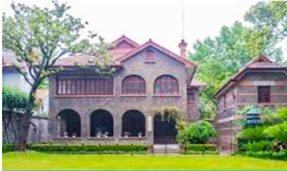
บ้านเกิดซุนยัตเซน

พักที่ IRVINE HOLIDAY HTL OR HUICHANG HTL 3* หรือโรงแรมในระดับเดียวกันในเมืองจูไห่