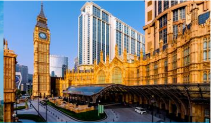
The Londoner Macao