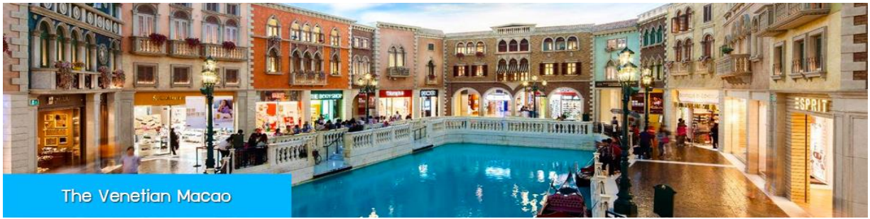
The Venetian Macao