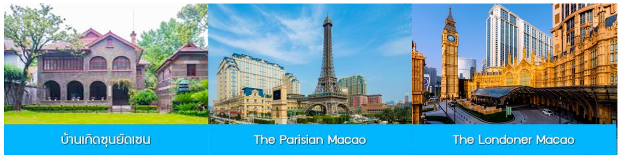
บ้านเกิดซุนยัตเซน

พักที่ IRVINE HOLIDAY HTL OR HUICHANG HTL 3* หรือโรงแรมในระดับเดียวกันในเมืองจูไห่