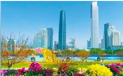
ไห่ซินซา