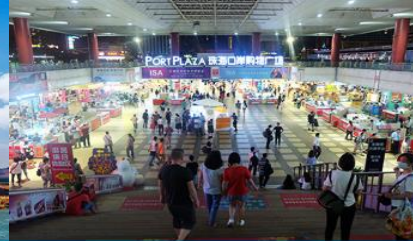
ตลาดใต้ดินกงเป๋ย