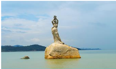
จูไห่พีชชอร์ริกิร์ล

พักที่ IRVINE HOLIDAY HTL OR HUICHANG HTL 3* หรือโรงแรมในระดับเดียวกันในเมืองจูไห่