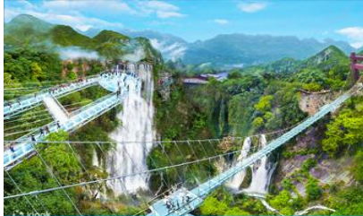
อุทยานงูหลมเสี่ย

23.00 น. คณะพร้อมกัน ณ ท่าอากาศยานสุวรรณภูมิ อาคารผู้โดยสารขาออก ชั้น 4 ประตู 10 เคาน์เตอร์สายการบิน 9AIR พบเจ้าหน้าที่บริษัทฯ คอยให้การต้อนรับและอำนวยความสะดวกด้านเอกสารและสัมภาระก่อนการเดินทาง