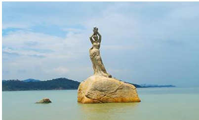
จูไห่พีชชอริเกิร์ล

พักที่ IRVINE HOLIDAY HTL OR HUICHANG HTL 3* หรือโรงแรมในระดับเดียวกันในเมืองจูไห่