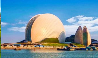
โรงละครงูเห่า