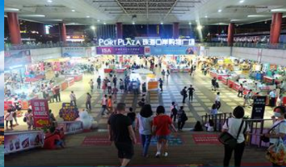
ตลาดใต้ดินกงเป๋ย