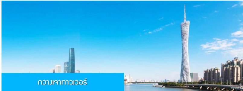
กวางเจาทาวเวอร์