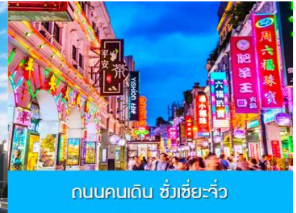
ถนนคนเดิน ชังเจี๋ยจิว