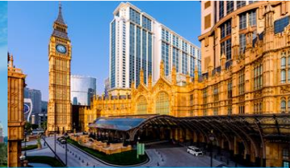
The Londoner Macao