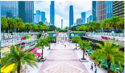
จตุรัสฮัวเวิง