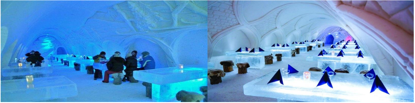
เที่ยง บริการอาหารกลางวัน ณ ภัตตาคาร

*** นำท่านเข้าชมภายในภัตตาคารน้ำแข็ง “SnowExperience365” ซึ่งเปิดบริการตลอดทั้งปี ภายในจะมีประติมากรรมน้ำแข็งที่น่าทึ่ง ให้ท่านได้เพลิดเพลินกับเครื่องดื่มพร้อมนั่งถ่ายรูป กับโต๊ะอาหารน้ำแข็งที่ล้อมรอบด้วยรูปปั้นที่สวยงาม และแก้วที่ใช้เสิร์ฟเครื่องดื่ม จะทำจากน้ำแข็งภายใต้อุณหภูมิลบห้าถึงลบสิบ องศาเซลเซียสแม้ในช่วงกลางฤดูร้อน”