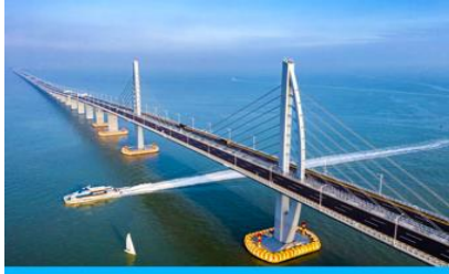
สะพาน ฮ่องกง จูไห่ มาเก๊า

นำคณะขึ้น Shuttle Bus ของโรงแรมเพื่อเดินทางไปด้วยกันผ่านพิธีการตรวจคนเข้าเมือง และนำท่านเดินทางสู่ที่พักในเมืองจูไห่ พักที่ IRVINE HOLIDAY HTL OR HUICHANG HTL 3* หรือโรงแรมในระดับเดียวกันในเมืองจูไห่