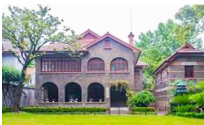
บ้านเกิดซุนยัตเซน

พักที่ IRVINE HOLIDAY HTL OR HUICHANG HTL 3* หรือ โรงแรมในระดับเดียวกันในเมืองจูไห่