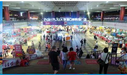
ตลาดใต้ดินก่งเป๋ย