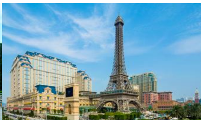
The Parisian Macao