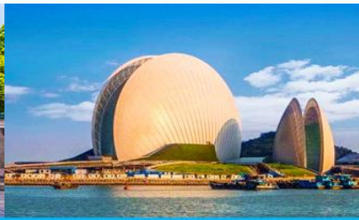
โรงละครงูเห่า