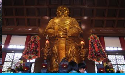
วัดแชกงมียิว

วันที่สี่ เมืองจูไห่-สะพาน HZMB-ฮ่องกง-อ่าวรีพลัสเบย์-จุดชมวิวไท่ผิงซาน-วัดแชกง-โรงงานจิวเวลรี-อิสระช้อปปิ้งย่านจิมซาจู้-จูไห่