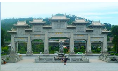
วัดงูเห่า