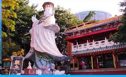
อ่าว Repulse Bay