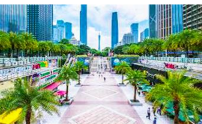
จตุรัสฮิวเอิง