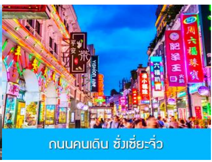
ถนนคนเดิน ชิวเซี่ยจิว