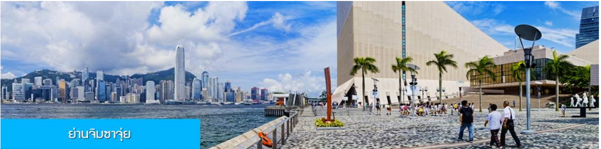
ย่านจิมซาจุ่ย