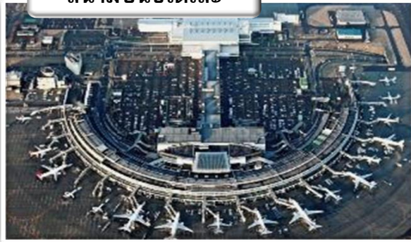
สนามบินชิตโตะเสะ

เวลา 23.50 น. ออกเดินทางสู่ สนามบินชิตโตะเสะ ประเทศ ญี่ปุ่น โดย สายการบินไทย เที่ยวบินที่ TG 670