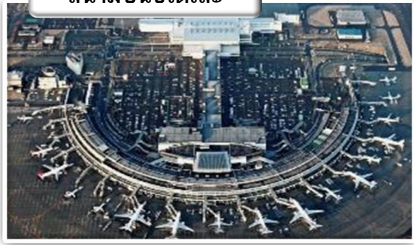
สนามบินชิตเสะ

เวลา 23.50 น. ออกเดินทางสู่ สนามบินชิตเสะ ประเทศ ญี่ปุ่น โดย สายการบินไทย เที่ยวบินที่ TG 670