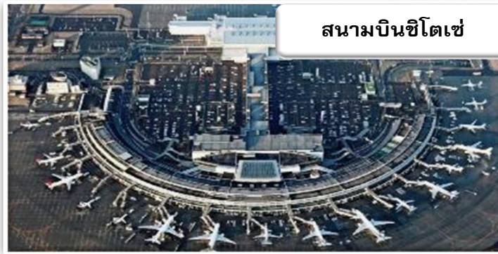
สนามบินชิตเซ่

บริการอาหารร้อนบนเครื่องพร้อมกับเมนูผลไม้สดเพื่อเติมเต็ม ความพิเศษไปพร้อมๆกับความสดชื่น