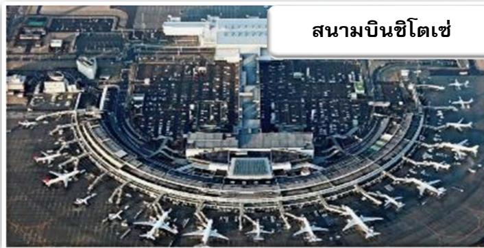
สนามบินชิตเซ่

บริการอาหารร้อนบนเครื่องพร้อมกับเมนูผลไม้สดเพื่อเติมเต็ม ความพิเศษไปพร้อมกับความสดชื่น