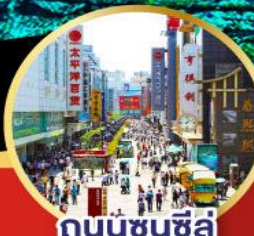
ถนนชุนชี่ลู่

ห้องพัก 4 ดาว ไม่เข้าร้านช้อปปิ้ง!! -เมนูพิเศษ สุกิหมาล่าเสฉวน , เปิดบักกิ้ง