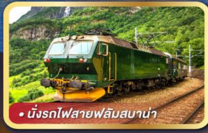
• นั้งรถไฟสายฟลัมสบาน่า