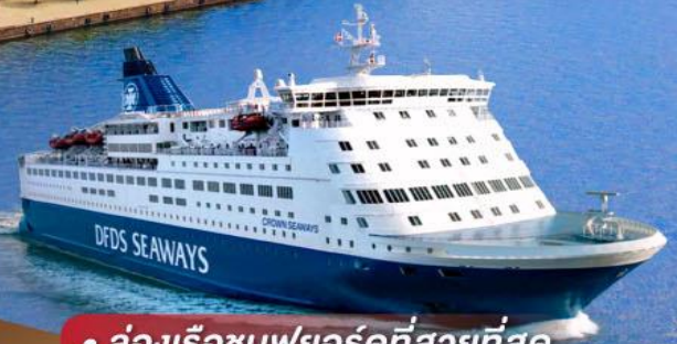
• ล่องเรือชมฟยอร์ดที่สวยงามที่สุด