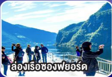
ล่องเรือช่องฟยอร์ด