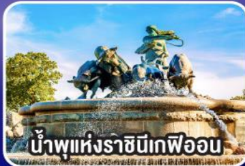
น้ำพุแห่งราชินีเกฟอน