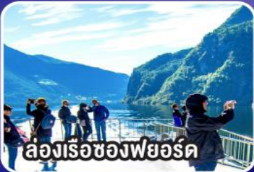
ล่องเรือของฟยอร์ด