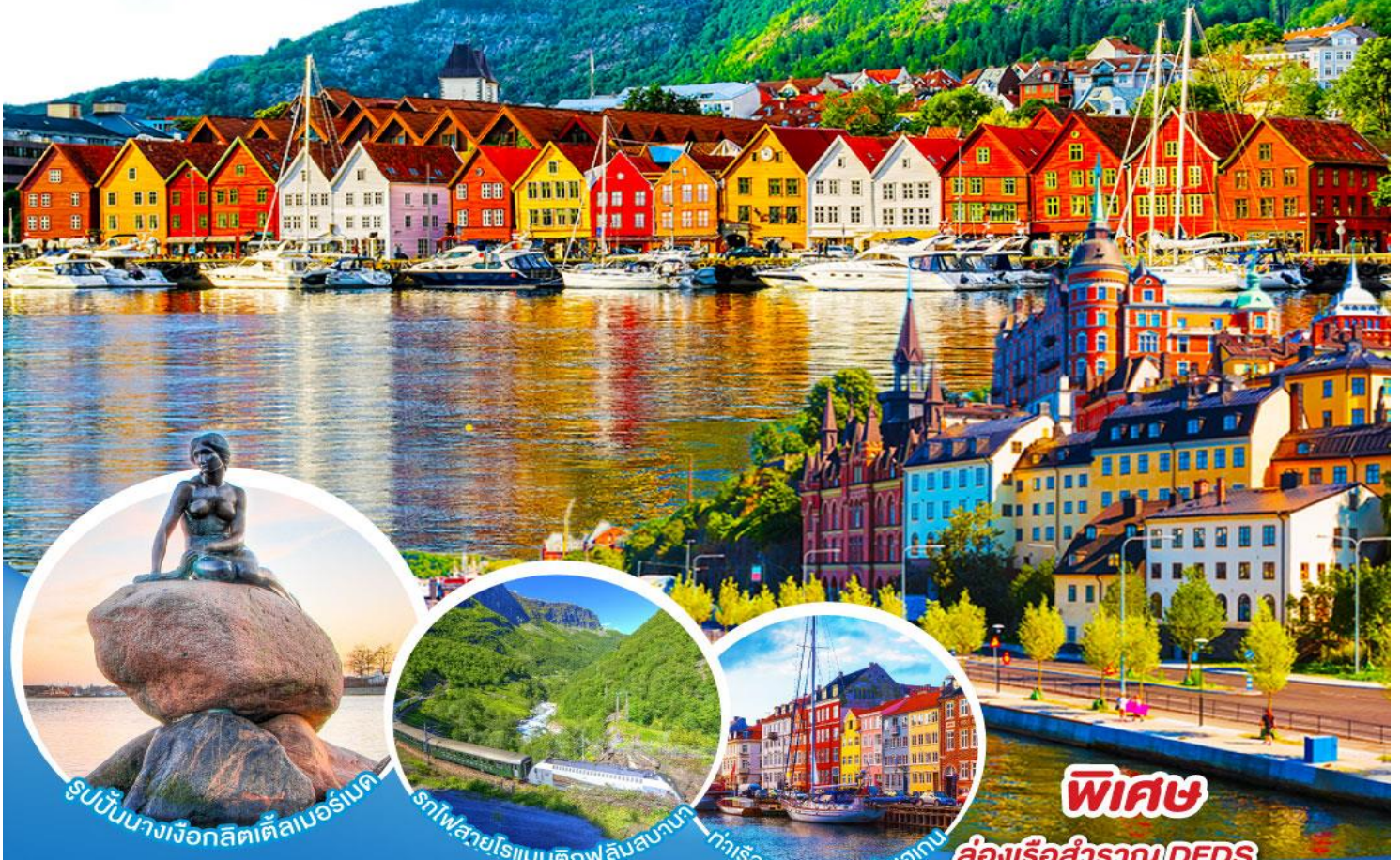
รูปปั้นนางเงือกลิตเติ้ลนอร์แมนด์