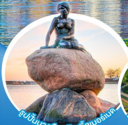
รูปปั้นนางเงือกลิตเติ้ลมอร์เนต