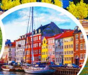
ท่าเรือฮาวน์.โตปเปอร์