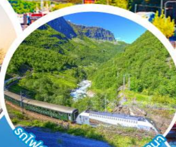
รถไฟสายโรเมนติกฟลัมสบานา